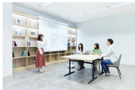
●コミュニケーションスペース:2F