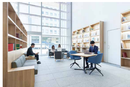
●コワーキングスペース:1F