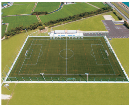
しらすぎ球技場(全天候型人工芝)