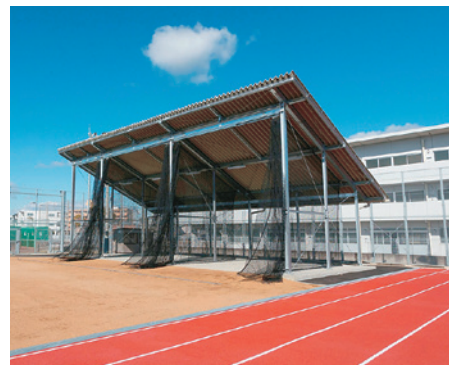
日ノ上グラウンド

詳細は「四国大学産学官連携シーズ集～連携可能な研究テーマとご利用いただける施設・設備の一覧～」もあわせてご参照ください。