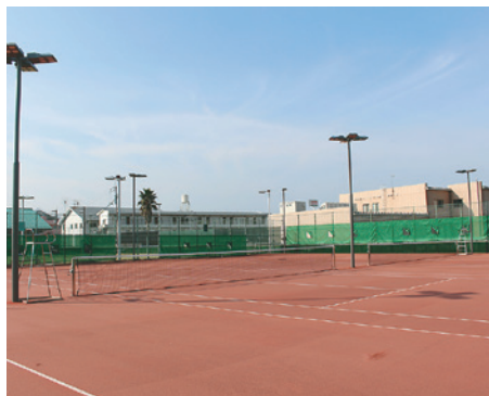
テニスコート(人工クレーコート)