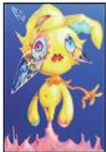
田中 綾乃 (2年)