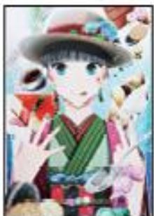
井村 圭穂 (2年)