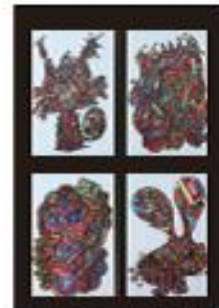
社頭 茉央 (3年)