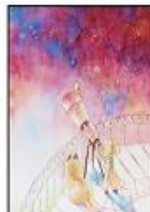
杉本 早 (2年)